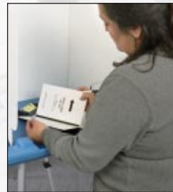
Votando con una boleta electoral de papel