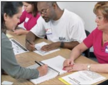
Firmando en el registro de la casilla electoral