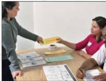
Obteniendo su boleta electoral o una tarjeta para votar por computadora